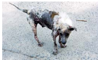
En av alla hundar.