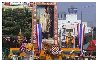
Jätteporträtt på stan.