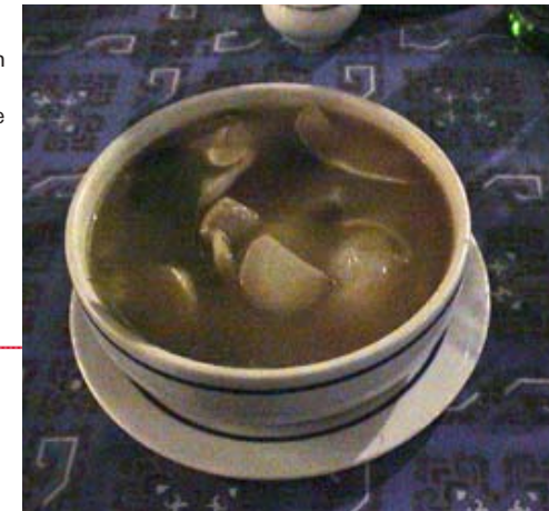
Stark "dom yom gung".

ra på pinne är en lokal favorit i Hua Hin och heter "jaeng lawn". Varje pinne har två bitar fisk och kostar bara fem B.