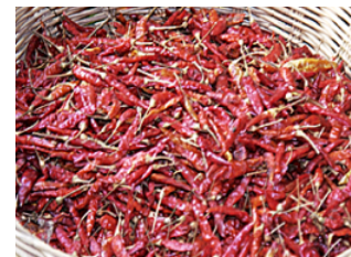
Myggmedel 2: chili.

Hin. Myggen. Det vimlar av mygg. Enligt ryktet blir thailändarna aldrig myggbitna eftersom de dricker mycket lokal whisky – och äter mycket chili.