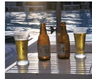
Ölen är god – men dyr.

All öl är "dyr" i Thailand. I alla fall om du jämför med de lokala priserna på allt annat. Literpriset på lokalt tillverkad öl (till exempel