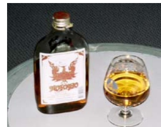
Myggmedel 1: whisky.

Bor du i bungalow eller liknande så kommer du att märka en av de få otrevliga invånarna i Hua