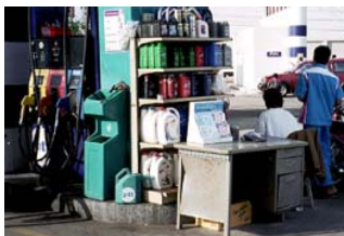
Kontorist vid pumpen.

Går du in i ett vanligt bostadsområde ser du snart ett garage som är knöckfyllt av symaskiner och folk som jobbar med att sy