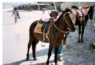
Ridning på stranden.

det en hel avdelning med skoluni- former. Något för dig som tröttnat på att köpa modekläder till dina barn!