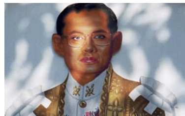
Kung Rama IX.

Folket älskar sin kung och alla har ett porträtt hängande i hemmet. Han är också intelligent och har bland annat skrivit ett översättningsprogram för datorer.