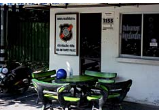
Turistpolisen i Hua Hin.

På bensinstationerna sitter ibland en kontorist med skrivbord och allt ute vid pumparna.